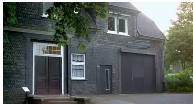
Alte Schule heute