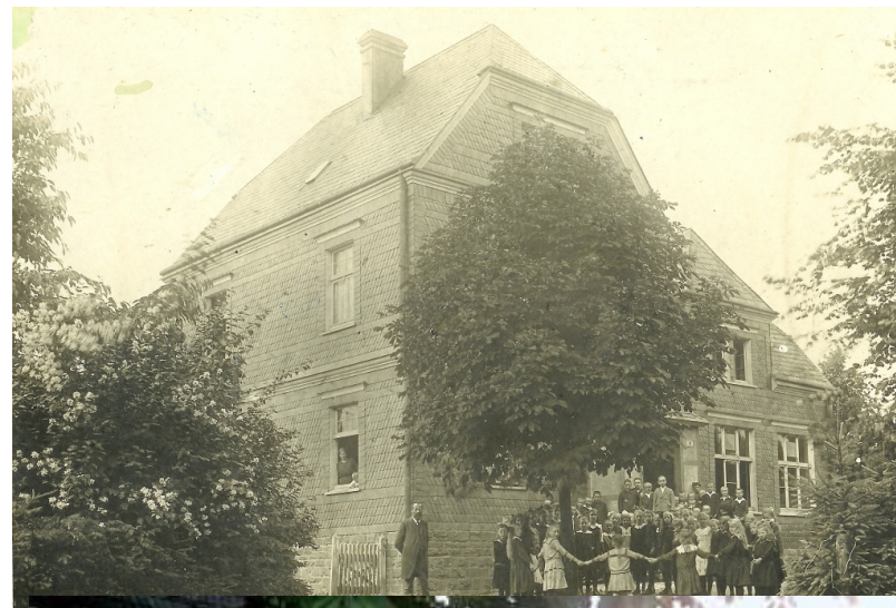
Schule in den 1950ern (Kastanie)