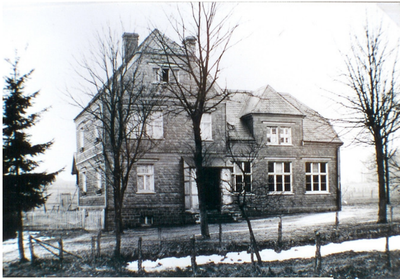
Neu erbaute Schule ab 1909