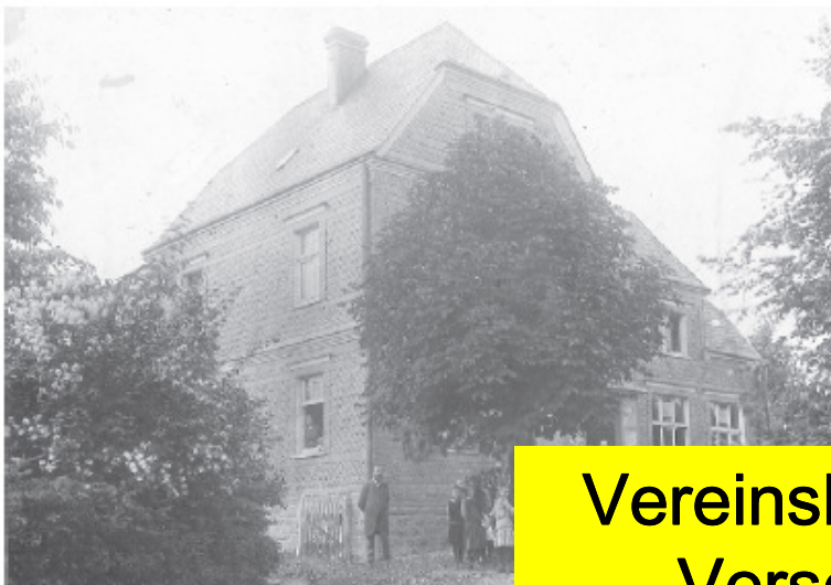
Das alte Schulhaus um 1930