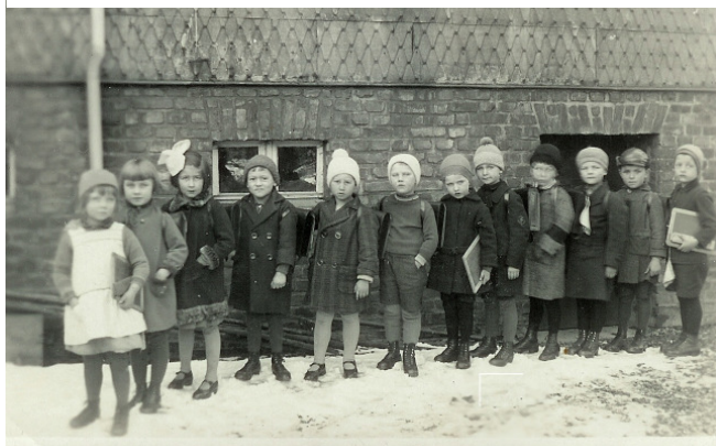
Schüler der ersten Klasse